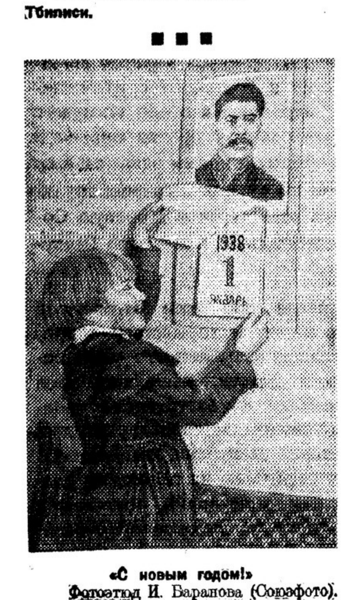
«С новым годом!»

Родная сердцу Барталиния, Ты мне запомнилась такой: Сады и горы в шапках инея, И ветер с гор, и небо синее, Река и крепость над рекой. Я в Гори был и видел юм, Ступил на стертые ступени — Под этим низким потолком Возник вольды бессмертных гений. Как оживить стихотворенье, Перенести в звучанье строк Великий смысл его рожденья И первый шаг через пороги, Как мне представить это время? — Арбы скрепяло колесо, По этой улице со всеми Шел рядом маленький Сосо. И было в мальчише такое, Чего веками ждал народ — И ум, и мужество большое, И мысли дерзостный полет... Родная сердцу Барталиния, Ты мне запомнилась такой: Сады, и горы в шапках инея, И ветер с гор, и небо синее, Река и крепость над рекой.