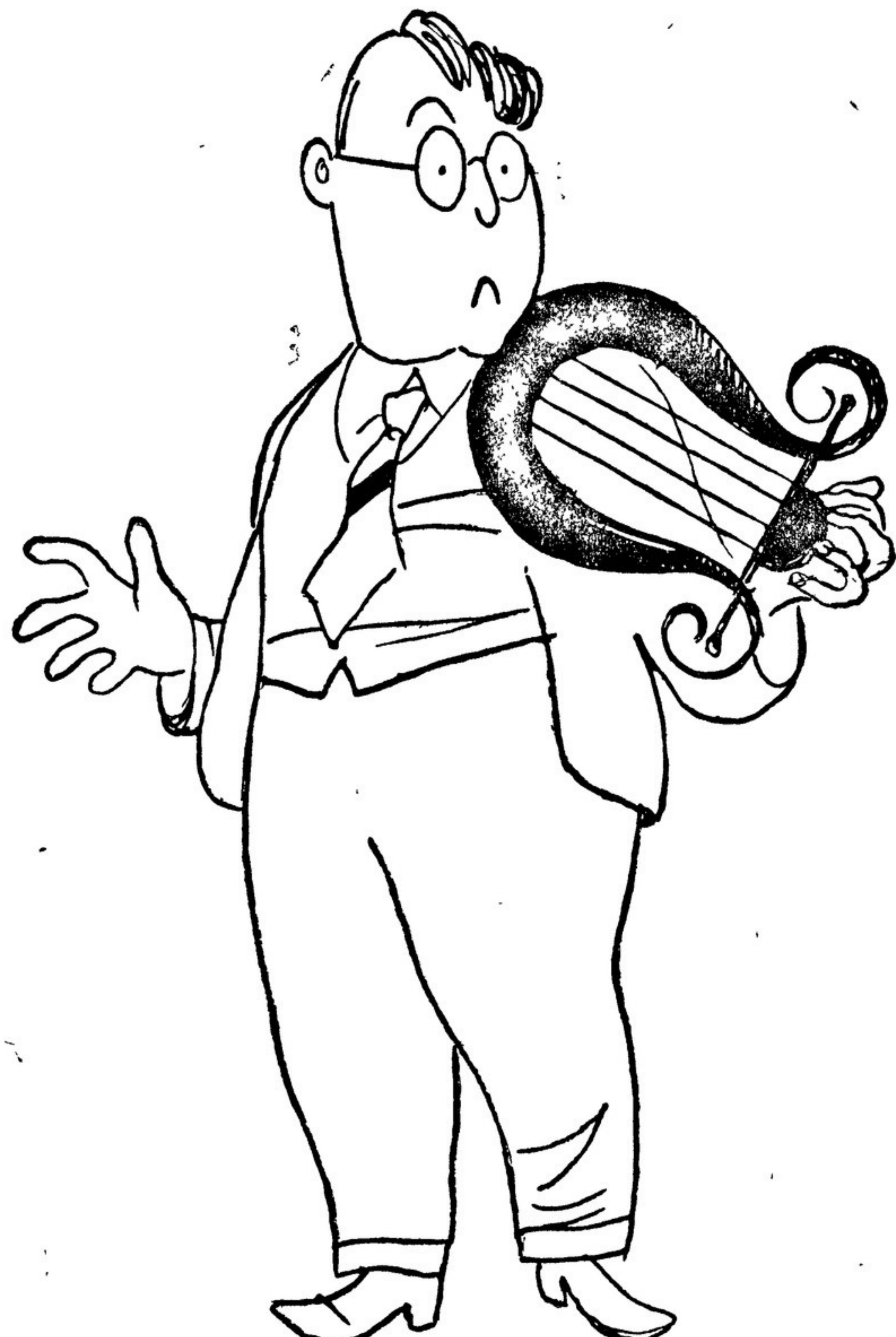
Лирики: Сунули в руку каку-то штучку и говорят — играй! А смычка-то и не дали.