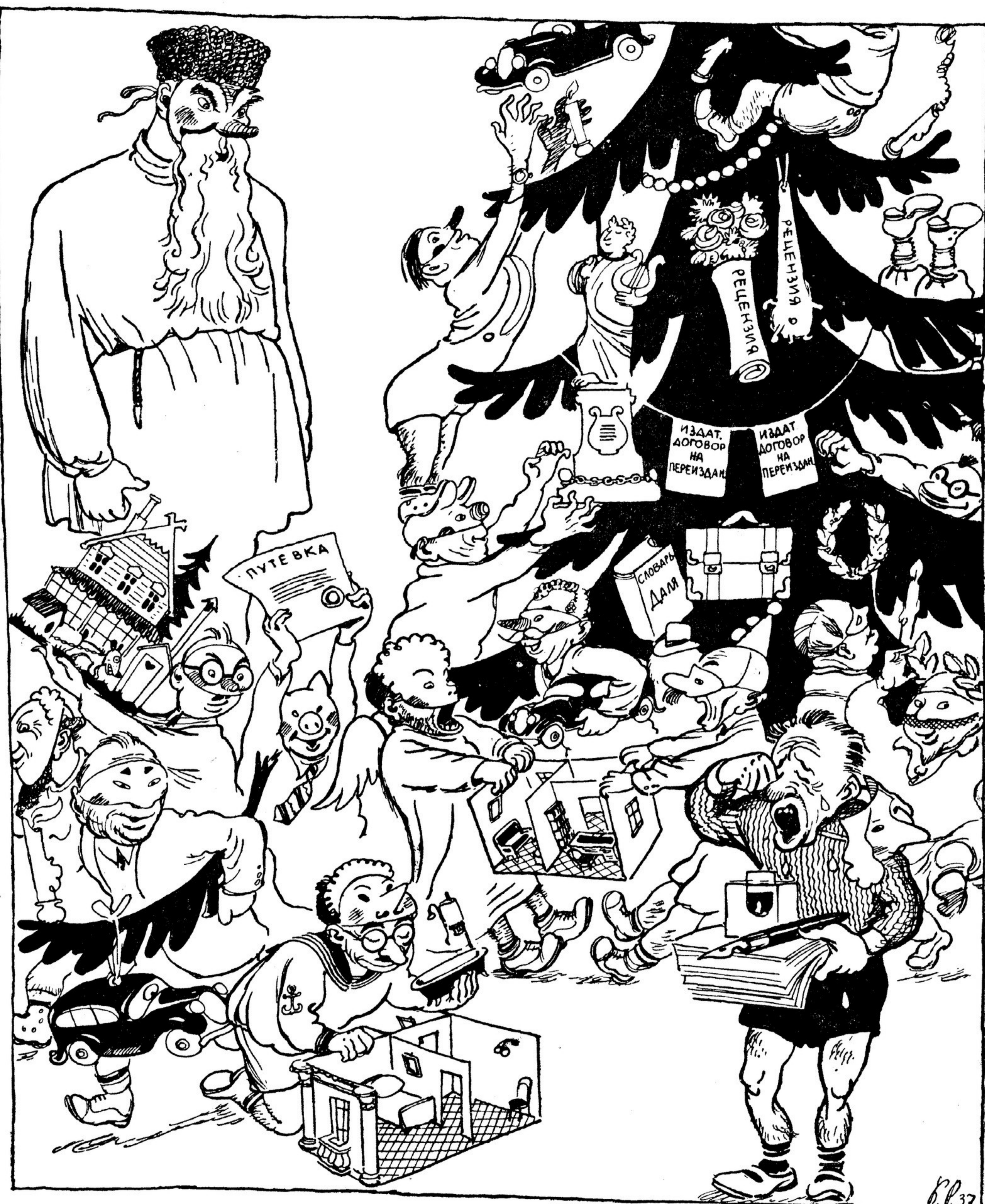
Обиженный писатель (справа). — А мне, чорт знает, что досталось — перо, чернила и бумага. Что я с ними буду делать?